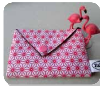
ZA'PRISTI 26000 VALENCE TÉL. 06 42 55 91 14