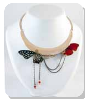
VICTORIAN REHAB 94120 FONTENAY SOUS BOIS Tél. 06 15 17 53 76