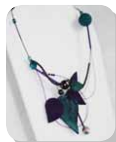
LUMIERE DE SOY 75015 PARIS TÉL. 06 20 30 35 52