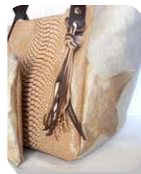
FIL DE BOHEME 13127 VITROLLES TÉL. 06 27 58 96 07