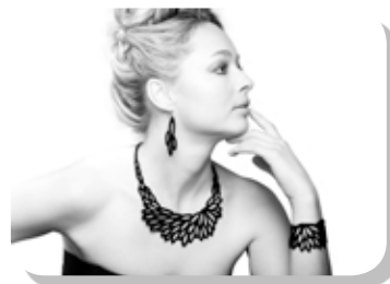
APARA 14980 ROTS TÉL. 06 83 57 36 18